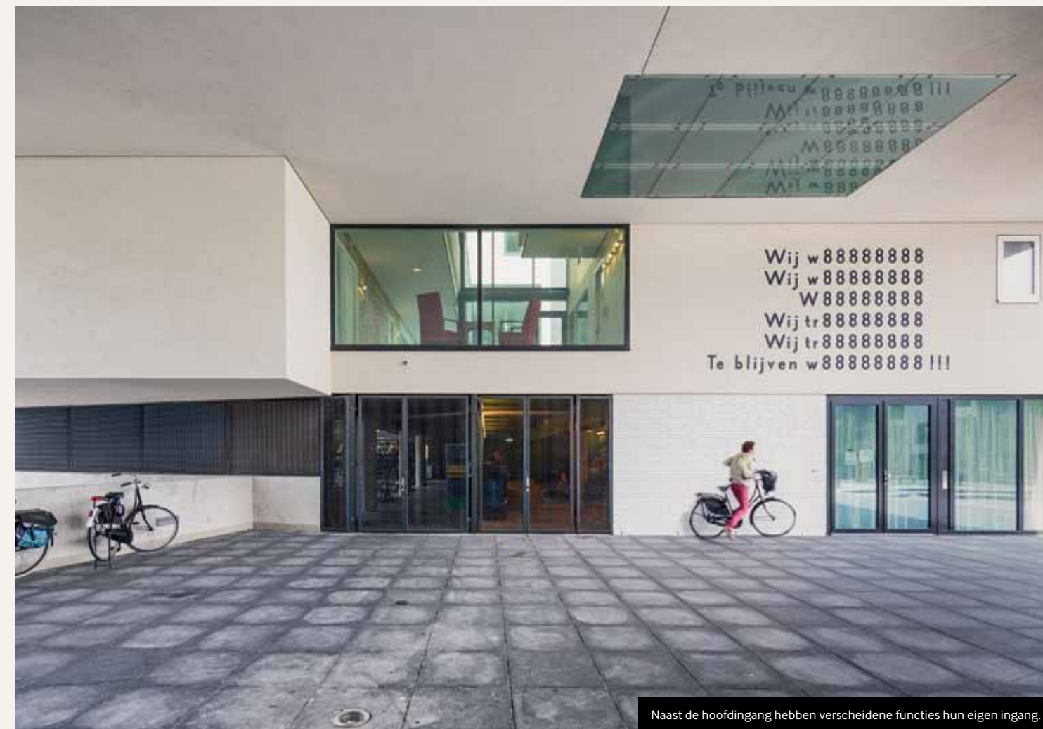
Naast de hoofdingang hebben verscheidene functies hun eigen ingang.

Verdichting en flexibiliteit gaan hand in hand. Dit komt ook tot uitdrukking in het ontwerp. Zo kan de centrale hal door het openen van de gevels in gebruik genomen worden als verlengstuk van de openbare ruimte, of met behulp van tussenwanden worden opgedeeld in kleinere besloten eenheden. Elders in het complex wordt de flexibiliteit van het gebouw op structurelere wijze op de proef gesteld. Wanneer nog voor de finale oplevering ruimtegebrek bij de naastgelegen school aan het licht komt, rijst de vraag of één van de appartementenblokken herbestedemd kan worden voor onderwijs. Het resultaat hiervan is een serie 'schoolwoningen', die tijdelijk dienst doet als uitbreiding van de lokalen en op termijn kan worden teruggebracht naar de oorspronkelijke woonfunctie.