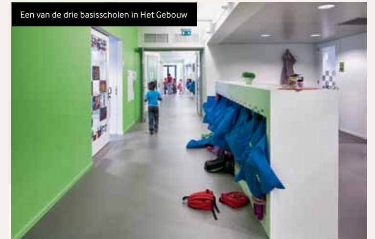
Een van de drie basisscholen in Het Gebouw