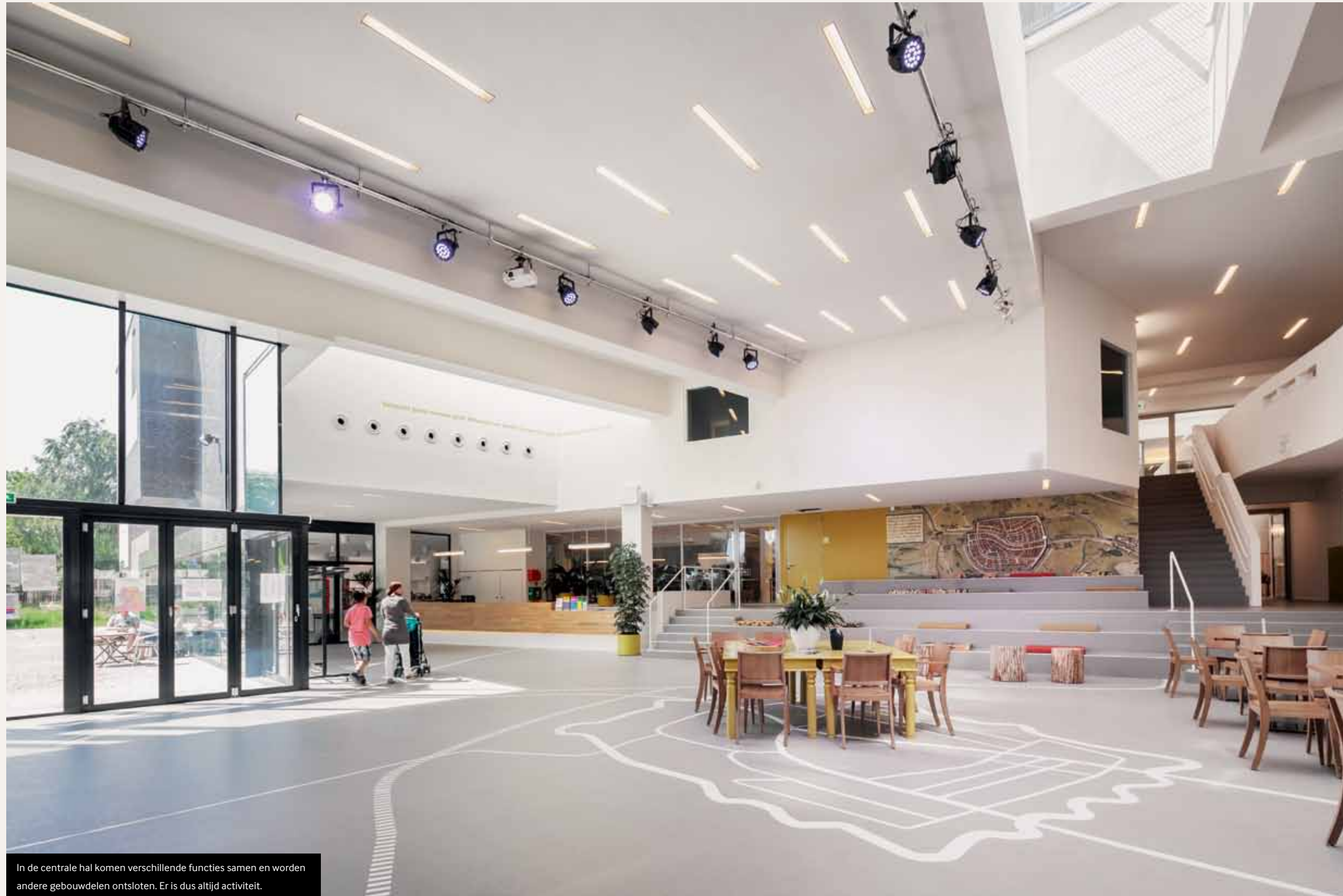
In de centrale hal komen verschillende functies samen en worden andere gebouwdelen ontsloten. Er is dus altijd activiteit.